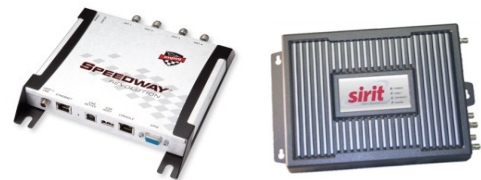
Reader R420 Impinj e Sirit IN510